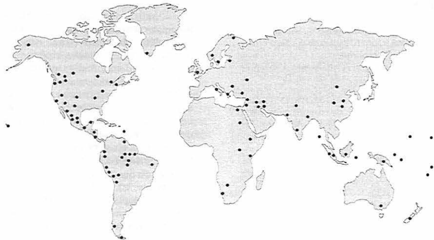
La répartition mondiale des récits du déluge ; chaque point représente une version régionale. D'après le Seventh-day Adventist Bible Dictionary , éd. rév. (Washington, D.C. : Review and Herald Publ. Assn., 1979), p. 374.

Une partie du dialogue sur cette divergence peut être relevée dans l'épopée d'Atra-hasis. La déesse-mère qui avait donné naissance à l'humanité regrettait la décision d'avoir déclenché le déluge : « Dans l'assemblée des dieux, comment ai-je pu, avec eux, ordonner la destruction totale ? » Elle déplore qu'Anu, le chef des dieux, ait été d'accord avec cette décision, « lui qui ne songea qu'à provoquer un déluge et livra les peuples à la destruction ». Elle demande encore jusqu'où les dieux sont-ils allés, « eux qui ne songèrent qu'à provoquer un déluge et livrèrent les peuples à la destruction ? Vous avez résolu une destruction totale. » ( Atra-hasis , p. 95, 97, 99.) La colère d'Enlil se révèle quand il pose la question : « Où la vie s'est-elle enfuie ? Comment l'homme a-t-il survécu à la destruction ? » ( Ibid. , p. 101.) Enki