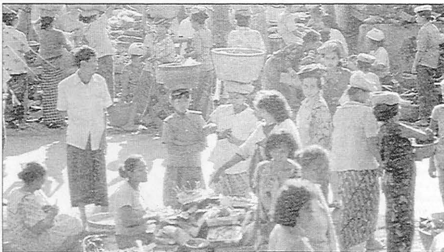
Les sociologues fixent leur attention sur les styles d'interaction entre groupes et sur l'influence de la culture sur le comportement humain.