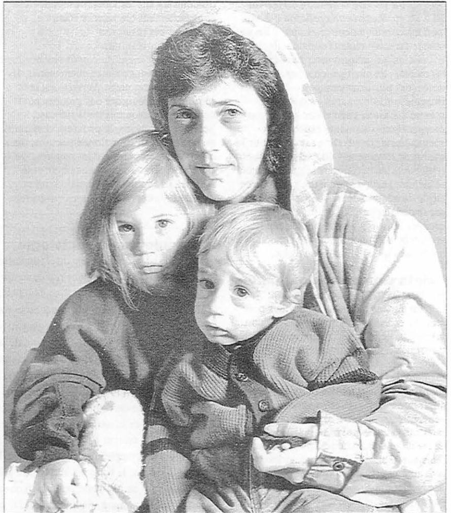
Les sociologues analysent les indices de richesse et de pauvreté pour découvrir dans quelle mesure les choix sociaux affectent le niveau économique.

En étudiant le phénomène de l'esclavage, des sociologues pourraient avancer que les chrétiens blancs justifiaient cette pratique par le fait qu'ils appartenaient au groupe culturel dominant possesseur d'esclaves et non à partir d'un enseignement biblique. Un exemple brûlant d'actualité est celui de l'opposition à la consécration des femmes de la part de la hiérarchie à