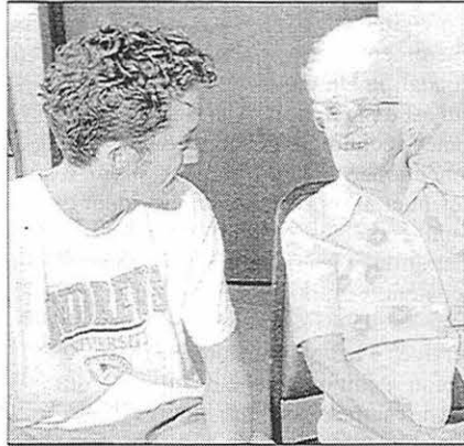
Rendre visite aux pensionnaires des maisons de repos est l'une des activités des classes de service.

A la suite d'un examen minutieux de la déclaration de mission, les membres du GEC décidèrent de formaliser l'engagement de l'université au service en en faisant l'axe du programme d'éducation générale. Les membres du comité étaient pleinement convaincus que les élèves devaient comprendre notre philosophie du service. Le GEC prit un vote selon lequel tout étudiant accepté à l'université selon les termes des prospectus publiés à partir de l'année scolaire