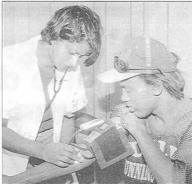
Les étudiants en soins infirmiers acquièrent de l'expérience et mettent en pratique leurs notions de service auprès des sans-abri de la région.

De diverses manières, les cours « S » serviront de moyens par lesquels étudiants et enseignants atteindront leurs objectifs scolaires en même temps qu'ils rendront service localement. Les notes ne seront pas données d'après la difficulté des projets de service, mais plutôt selon une évaluation de l'ensemble de l'expérience individuelle d'apprentissage. Les échanges réfléchis entre élèves et enseignants constituent un