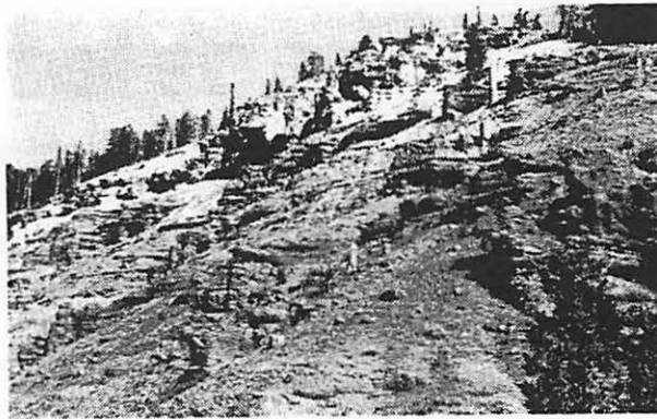
Ilustración 1. Una porción del Specimen Creek Petrified Forest, en el parque nacional de Yellowstone. Nota varios tocones verticales petrificados que se ven en esta ladera erosionada.

Si los árboles fueron arrastrados de un bosque en crecimiento y transportados por agua hasta donde se encuentran ahora, algunas de las raíces, particularmente las grandes, estarían quebradas. Cuando se arrasan los árboles para hacer claros en el bosque, sus raíces más pequeñas generalmente se conservan intactas, pero las grandes a menudo se quiebran. He encontrado varios ejemplos de raíces "quebradas" que terminan abruptamente, asociadas con los árboles petrificados erectos en el Yellowstone. Muchos otros ejemplos sugieren una repentina terminación de sus raíces, pero a