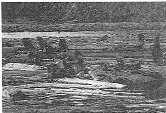
Ilustración 3. Tocones en posición vertical forman una parte de la gigante masa flotante de troncos en la superficie del Spirit Lake, cerca del Monte St. Helens. Aquellos que se elevan sólo unos pocos centímetros por encima de la superficie del agua, no son visibles en esta foto.